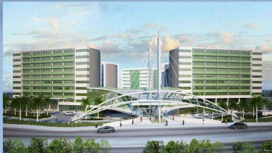
Escritório - Hangar Business Park

A COMDADOS conta com uma equipe de profissionais altamente qualificados nas áreas de: Vendas, Suporte Técnico, Consultoria em Comunicação de Dados e Cabeamento estruturado.